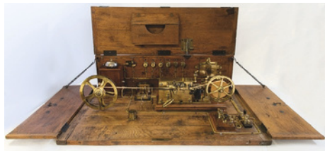
Appareil Morse dit « municipal » 1880 – cuivre, laiton, métal et caisse en chêne

de l'électricité résultent de nombreuses expérimentations en Europe et aux Etats-Unis, qui s'accroissent au XIXe siècle. De 1832 à 1839, le télégraphe électrique est ainsi le fruit des recherches respectives des physiciens William Cooke et Charles Wheatstone en Angleterre et du peintre