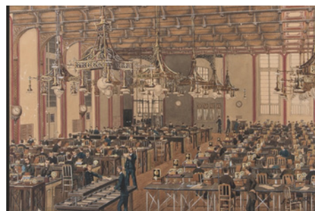
Central télégraphique de Paris-Grenelle. La salle de la Rosace, 1889, J. Schiils – 1889, aquarelle sur carton

en mars 1851, bouleversant le système de communication des nouvelles. L'invention profite d'abord aux hommes d'affaires qui ont le regard rivé sur les cours de la Bourse, aux commerçants et à leurs fournisseurs et aussi aux agences de presse alors en pleine expansion.