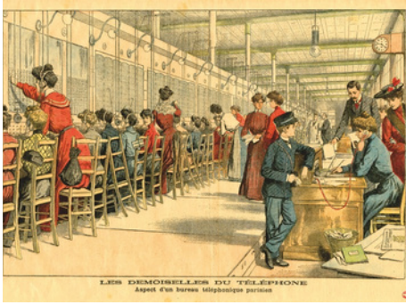
Les demoiselles du téléphone, aspect d'un bureau téléphonique parisien, début 20e siècle, illustration extraite du supplément illustré du Petit journal du 17 avril 1904

Dans les premiers temps du téléphone, il n'y a pas de liaison automatique entre abonnés, il faut recourir à un « bureau central » qui établit la correspondance entre les appelants. Cette connexion, appelée « commutation téléphonique », est assurée manuellement par des opératrices - le métier est essentiellement féminin-. L'appel déclenche un signal électrique qui arrive au central et fait tomber un volet derrière lequel est fixé le nom de l'appelant (qui devient ensuite un matricule). Celui-ci demande à avoir le numéro d'un correspondant, l'opératrice branche deux fiches jack pour les mettre en relation. Ces derniers doivent souvent patienter, le réseau n'ayant pas une grande capacité. En 1910, il fallait attendre 2h pour appeler de Cannes à Marseille ! Le nombre des opératrices et l'importance de ces centraux augmentent considérablement avec le développement du réseau téléphonique, jusqu'à l'automatisation généralisée des systèmes de connexion, commencée en 1915 mais achevée dans les années 1970.