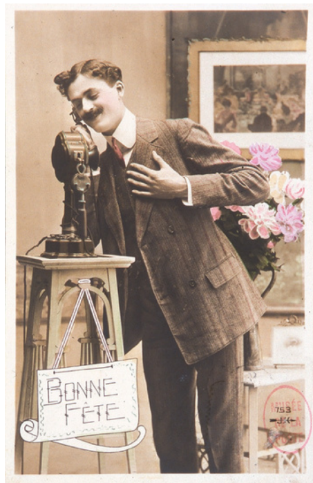
Carte postale fantaisie mettant en scène la popularisation du téléphone comme nouveau moyen de communication instantané, France, début du 20e siècle, tirage photographique en noir et blanc et en couleur sur carte postale

Les progrès techniques se poursuivent et s'accroissent à la fin du XIXe siècle avec la transmission enfin possible de la voix sur une longue distance. Pour cela, le son est transformé en courant électrique, produit par la vibration, au contact de la voix, de lames métalliques entre les pôles d'un électro-aimant. Ce courant est transporté par câble électrique, à son extrémité un dispositif identique permet de reproduire la voix. C'est à l'Écossais Graham Bell que revient la paternité de l'invention du téléphone en 1876. En France, le système Bell est adopté par la maison Breguet qui fabrique les premiers postes. Mais le téléphone ne