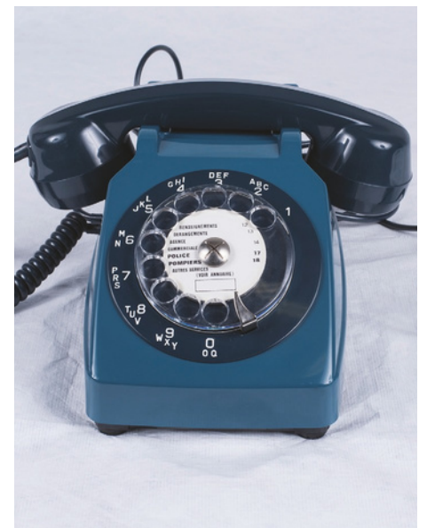
Téléphone, poste mobile à cadran S63, bleu, Société des constructeurs de téléphones, 1963-1985.

modèles portatifs que l'on trouve sur les bureaux apparaissent les appareils muraux au design austère. Face à l'abondance de modèles, pas toujours de bonne qualité, l'Administration adopte dès 1924 un modèle unique, sobre et solide, à cadran, en bakélite noire. Dans les années 1960, le plastique s'impose et en 1980, le clavier remplace le cadran. Depuis longtemps tombés en désuétude, ces téléphones sont devenus « vintage » et recherchés des collectionneurs.