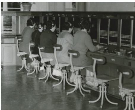
Standard téléphonique en Dordogne, vers les années 1960

Dans les premiers temps du téléphone, il n'y a pas de liaison automatique entre abonnés, il faut recourir à un « bureau central » qui établit la correspondance entre les appelants. Cette connexion, appelée « commutation téléphonique », est assurée manuellement par des opératrices - le métier est essentiellement féminin-. L'appel déclenche un signal électrique qui arrive au central et fait tomber un volet derrière lequel est fixé le nom de l'appelant (qui devient ensuite un matricule). Celui-ci demande à avoir le numéro d'un correspondant, l'opératrice branche deux fiches jack pour les mettre en relation. Ces derniers doivent souvent patienter, le réseau n'ayant pas une grande capacité. En 1910, il fallait attendre 2h pour appeler de Cannes à Marseille ! Le nombre des opératrices et l'importance de ces centraux augmentent considérablement avec le développement du réseau téléphonique, jusqu'à l'automatisation généralisée des systèmes de connexion, commencée en 1915 mais achevée dans les années 1970.