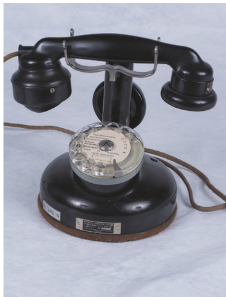
Téléphone, poste mobile à cadran PTT 24, Charles Mildé fils et Compagnie, 1924 - bakélite, métal, plastique

L'automatisation progressive des centraux téléphoniques améliore leur quotidien et leur rendement jusque dans les années 1970 où l'apparition des centraux électromécaniques de nouvelle génération met définitivement fin au règne des demoiselles du téléphone.