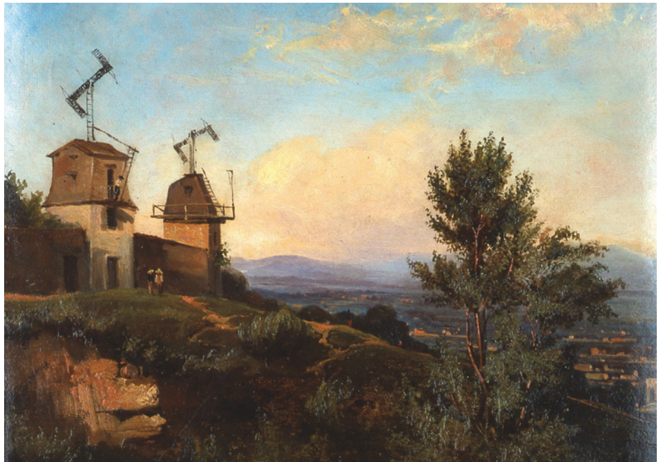
Télégraphe Chappe à Saint-Just (actuel quartier de Lyon) vers 1840, Anonyme, vers 1840, peinture à l'huile sur papier

C'est déjà le chant du cygne pour le télégraphe Chappe qui se voit concurrencé dans les années 1840 par l'arrivée du télégraphe électrique. Tous les postes de