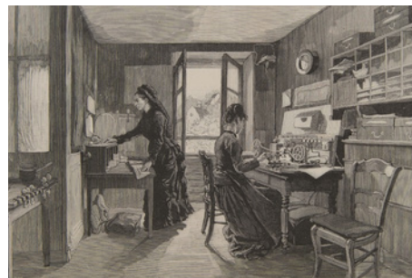
Dans un village des environs de Paris un bureau de poste et télégraphe, B.T.D – fin 19e siècle, lithographie

Viennent là-bas le long du quai Sur son sein notre République À mis ce bouquet de muguet Qui poussait dru le long du quai Allons plus vite nom de Dieu Allons plus vite » Apollinaire, Allons plus vite , (extrait)