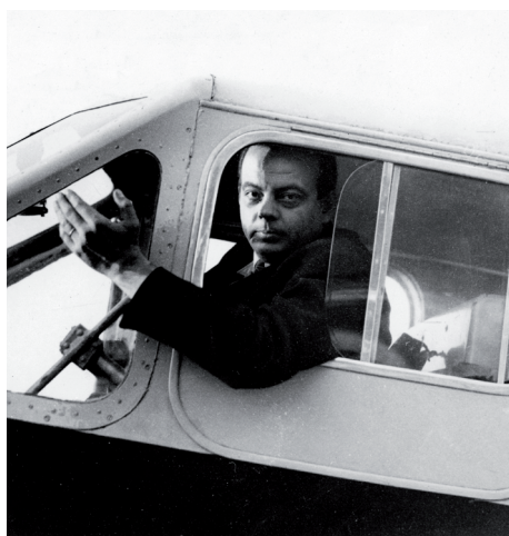
Antoine de Saint-Exupéry dans son Caudron-Simoun

en continuant les vols d'exploration. Mais la mer a raison de l'homme qui disparaît dans l'océan le 7 décembre 1936. A propos de lui, Didier Daurat témoigne : « Mermoz était d'un tempérament indiscipliné et anarchiste. Mais à notre contact, il avait vite compris la vérité et la beauté du travail. C'était un homme très généreux, fait pour répandre le bien autour de lui. Il y avait en lui comme un besoin de servir et de se dévouer pour les grandes causes. Voilà pourquoi, d'emblée, Mermoz est devenu chez nous comme une figure de proue que l'on trouvait dans tous les coups, chaque fois qu'il y avait une difficulté à vaincre ou un exemple à donner ».