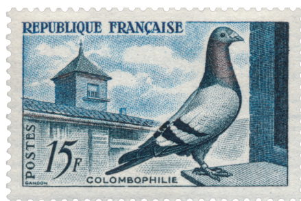
Timbre Colomphilie, 1957, Pierre Gandon

communiquer avec l'extérieur, il faut une autre solution pour apporter des nouvelles de la province vers Paris. Les pigeons voyageurs (connus et utilisés depuis l'Antiquité) sont employés dans ce but et pris à bord des ballons dans des cages accrochées aux nacelles. A l'arrivée, ils sont convoyés à Tours d'où ils rejoignent leur colombier parisien, porteurs de messages : un petit tube contenant 20 à 30 000 dépêches microphotographiées attaché à leur queue. À Paris, ces dépêches - lettres