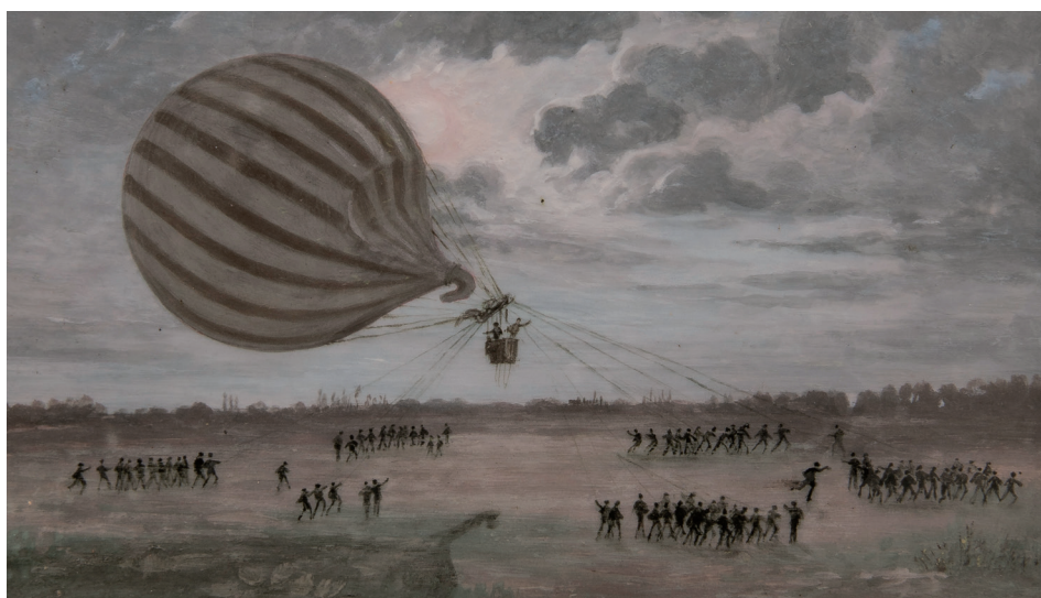
Le Jean Bart traîné par les mobiles d'Orléans, se rend au camp de Chilleur, novembre 1870, Louis-Lucien d'Eaubonne d'après Albert Tissandier 19e siècle (2e moitié) peinture émaillée sur terre cuite

C'est durant le siège de Paris que naît la première poste aérienne française. La guerre franco-allemande, souhaitée par Bismarck qui y voit l'unité de l'Allemagne, est déclarée le 19 juillet 1870 par Napoléon III dans un contexte diplomatique défavorable à la France. Après la chute de ce dernier à Sedan le 2 septembre 1870 et la proclamation d'un gouvernement républicain de défense nationale, les Prussiens assiègent Paris pour forcer le gouvernement à se rendre et terminer la guerre. Les liaisons