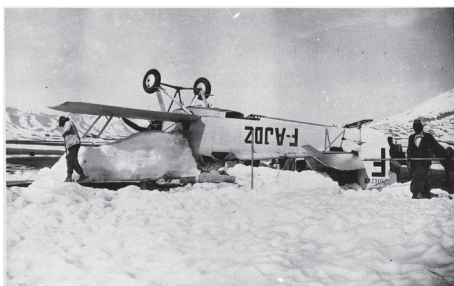
Potez 25 de Guillaumet sur le dos

1928, elle représente une victoire sur la chaîne andine, en reliant en 1929 Santiago du Chili. Déjà vaincue par des aviateurs dont Adrienne Bolland en 1921, la Cordillère est un défi pour les appareils de l'époque plafonnant à 4500 mètres. Mermoz veut franchir l'obstacle par le plus court chemin, soit la partie la plus élevée de la chaîne montagneuse. L'objectif est atteint en mars 1929, non sans de nombreuses péripéties. Grâce à la mise en service quelques mois plus tard, de nouveaux avions, les Potez 25, qui peuvent voler à 7 000 mètres, les vols hebdomadaires sont officialisés entre Buenos-Aires et Santiago. Responsable de ce secteur, le pilote Henri Guillaumet effectue près de 350 vols entre l'Argentine et le Chili. Au cours d'une ses traversées, il est victime d'un accident qui contribue à sa légende : le 13 juin 1930, son avion est pris dans une tempête, forçant Guillaumet à se poser dans de mauvaises conditions. Complètement isolé, il se résigne prendre la route pour trouver du secours, et marche 5 jours et 4 nuits, dans la neige à plus de 3000 mètres d'altitude, les pieds gonflés et gelés. A Saint-Exupéry venu le chercher, il déclare « ce que j'ai fait, aucune bête ne l'aurait fait »