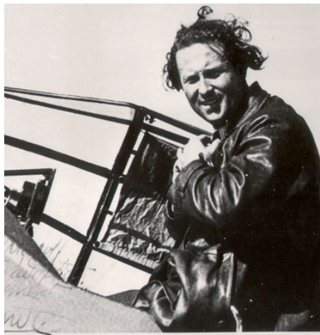
Portrait de Jean Mermoz, sans date

Russie, Espagne, Allemagne tandis que ses livres sont portés au cinéma et au théâtre. Au lendemain de l'armistice de 1940, il s'exile à New York. Il est désormais l'un des derniers survivants des pionniers de la ligne et brûle de reprendre le combat. Mobilisé en août 1943, il disparaît au large de Toulon en juillet 1944 lors d'une mission de reconnaissance. Le petit prince , son œuvre la plus connue, est publiée en 1943 à New-York, simultanément en anglais et en français, et reçoit des critiques élogieuses. En France, la première édition est posthume (1946) mais connaît un succès immédiat (10 000 exemplaires vendus en juin 1946)