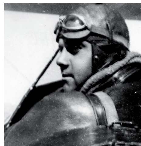
Henri Guillaumet

Latécoère en 1926. Après avoir effectué des dizaines de liaisons entre Toulouse et Dakar, il rejoint Mermoz en Amérique du Sud en 1929 pour organiser le réseau. Il va effectuer près de 350 vols au dessus de la Cordillère des Andes et c'est au cours d'une de ces traversées, en 1930, que Guillaumet est victime de l'accident qui le fera surnommer « l'ange de la Cordillère ». Au début de la guerre, Guillaumet est mobilisé. Au lendemain de l'armistice de 1940, il sert la compagnie nationale Air France qui a succédé à l'Aéropostale en 1933. C'est au cours d'un vol vers Beyrouth qu'il disparaît au large des côtes de l'Afrique du Nord le 27 novembre 1940, abattu par erreur dans une bataille aérienne anglo-italienne.