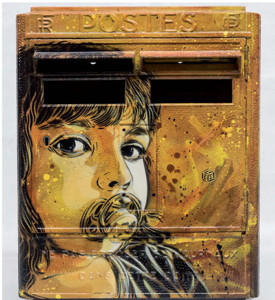
Nostos , Christian Guémy, dit C215, boîte aux lettres – 2012, pochoir et acrylique sur boîte aux lettres murale

Citons parmi d'autres, l'artiste Skall qui crée la Boîte de lumière, série de boîtes aux lettres recouvertes de peinture à paillettes (1995) ou encore le street artiste C215 qui les métamorphose avec ses portraits au pochoir. Le Musée de La Poste a consacré plusieurs expositions ainsi qu'un espace de ses collections à ces créations. On peut citer par exemple l'exposition « Paint B.A.L » qui eut lieu en 2012 et proposait aux artistes de rue de s'emparer librement des boîtes à l'aide de toute technique.