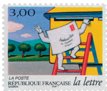
Timbre La lettre , 1997, Henri Galeron, Michel Durant-Mégret