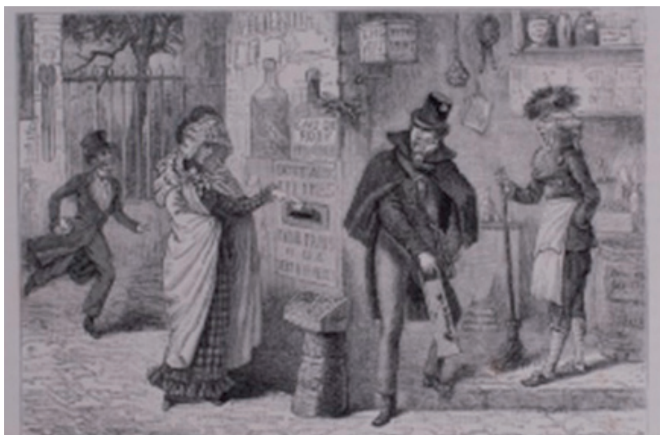
La boîte aux lettres à Paris , vers 1818, Ed. Garnier – Lithographie

qui permet à la fois la collecte et la distribution du courrier en zone urbaine. La boîte aux lettres réapparaît : une centaine d'entre elles sont installées dans les quartiers de la capitale. A la fin du XVIII e siècle, le Royaume en compte environ 500, exclusivement installées dans les villes. Un siècle plus tard, elles sont près de 50 000 sur tout le territoire français !