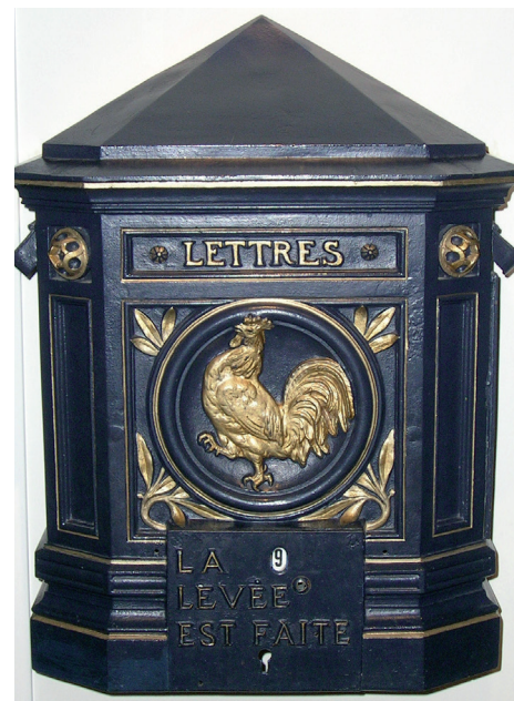
Boîte aux lettres type « Au coq gaulois » Delachanal-Gonste - 1925 (?), fonte moulée, peinte

nées 1990. La « Simyanette », boîte aux lettres urbaine promue en 1908 par Jules Simyan, autre sous-secrétaire des Postes, ne connut pas le même succès. Ornée d'un coq gaulois, cette boîte spéciale était en service à Paris et installée à la sortie des bouches de métro. Elle disparaît après 1909. Un autre modèle « au coq » apparaît en 1925 fabriqué par Delachanal-Gonste mais sera peu répandu.