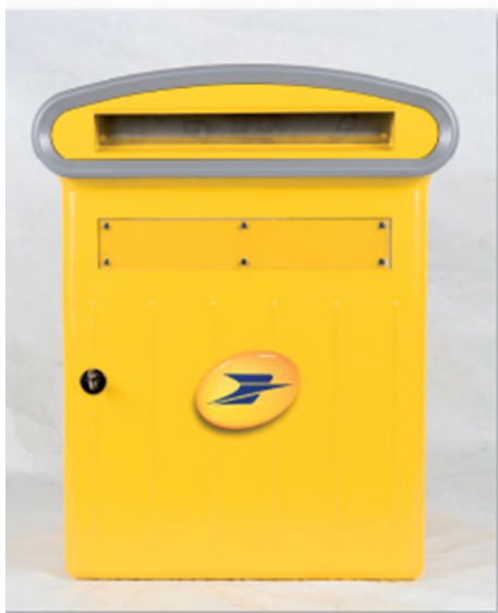
Boîte aux lettres petit volume , Dejoie – 2016, fonte d'aluminium

naissance de boîtes aux lettres de jour et de nuit, distinctes par la couleur de leur chapeau (orange et bleu) pour des dépôts tardifs. Elles sont plus visibles, plus grandes et plus accessibles (indications en braille) et existent en « drive » pour les personnes en fauteuil roulant et automobilistes qui peuvent déposer leur courrier sans avoir à descendre de voiture.