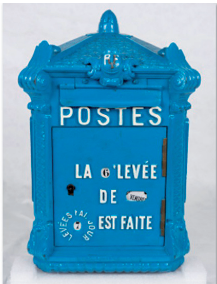
Boîte aux lettres dite « Mougeotte » Delachanal, modèle 1900 (type 1) fonte moulée

à patine florentine », elle se teinte en bleu en 1905. Aimée du public, la « Mougeotte » connaîtra une grande longévité qui la mènera jusqu'aux an-